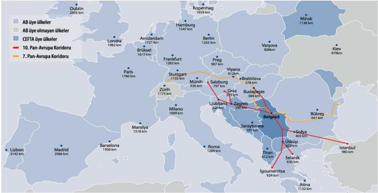
Resim 1. Sırbistan’ın Avrupa Bölgesinin Önemli Ulaşım Koridorlarındaki Pozisyonu

Sırbistan’ın bu avantajlı coğrafi konumuna ilaveten 2,7 milyar kişiye gümrüksüz erişim sağlayan ticaret anlaşmaları ağı, Sırbistan’ı yatırım açısından cazip bir hale getirmektedir. Ayrıca 2014 yılı başında Sırbistan’ın AB’ye üyelik müzakereleri başlamış olup bu kapsamda önemli yasal uyumlaştırmalar gerçekleştirilmiş ve gerçekleştirilmeye devam etmektedir. Sırbistan’da yatırım ortamı, AB müzakere süreciyle birlikte gelişmeye başlamıştır. Son dönemde Sırp Hükümeti de özellikle yabancı yatırımların ülkeye gelmesi konusunda çaba sergilemektedir. Ancak bürokrasi süreçlerinde öngörülemez durumlar ve gecikmeler yaşanabilmektedir.